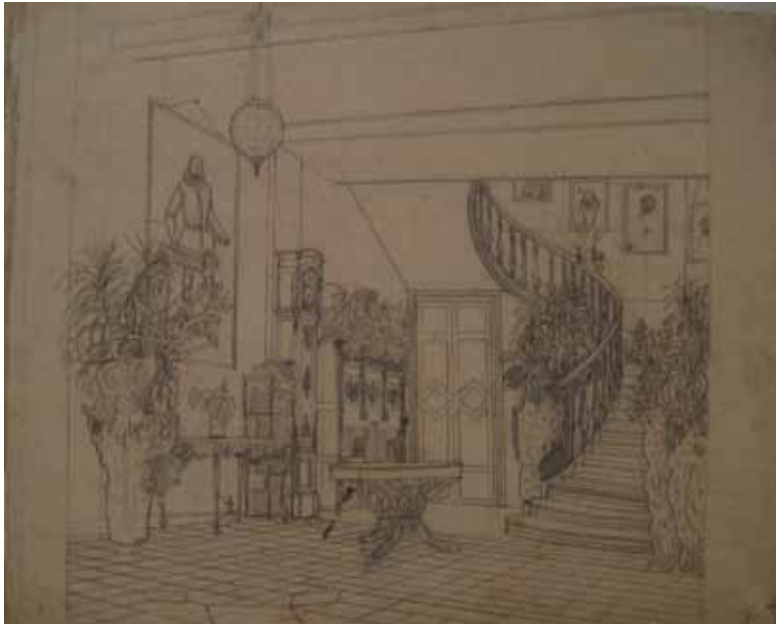
· Afb. 3 Barones Kervyn de Lettenhove, geb. barones Hélène Snoy, Vestibule van het ouderlijk kasteel van Bois-Seigneur-Isaac, ca. 1890. Privéverzameling. Foto: auteur.

en een pronkkast die naar een dubbele deur achterin leiden. Rechts brengt een gedraaide trap via geportretteerde familieleden naar de eerste verdieping. De ruimte is aangevuld met veel groen: hoge vazen met diverse planten flankeren de trap naast de potplanten op de pronkkast en consoletafel (Afb 3).