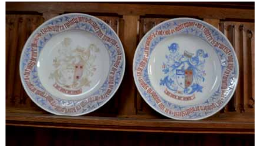
· Afb. 6 Kinderen van baron Jean-Baptiste Bethune en Emilie van Outryve d'Ydewalle, Jubileumborden, 1873. Marke, archief de Bethune.

tijdens de 19de eeuw. Ook de kinderen van barones Jean-Baptiste Bethune, geboren Emilie van Outryve d'Ydewalle (1826-1894) en baron Jean-Baptiste Bethune (1821-1894) deden het en bakten de afgewerkte producten in een oven in het kasteel van Marke. Ze vonden beschilderde porseleinen borden zelfs het ideale geschenk voor het vijftienvigti jarig huwelijksjubileum van hun ouders. Het is niet geweten welke plek de objecten vervolgens kregen, maar de goede bewaring impliceert dat de jubilarissen het cadeau erg waardeerden. In het midden van de borden is een wapenschild afgebeeld dat een combinatie is van de wapens van de geslachten Bethune en van Outryve d'Ydewalle. Daaronder staat de wapenspreuk van de familie Bethune ' Nec auro nec armis ' (noch met goud, noch