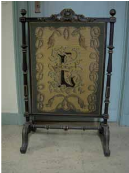
· Afb. 5 Prinses Louise-Marie d'Orléans, koningin van België, Geborduurd haardscherm met de gekroonde letter L, 1831-1850. Brussel, BELvue Museum, verzameling dynastie en cultureel erfgoed.

Meer dan een halve eeuw eerder hanteerde ook prinses Louise-Marie d'Orléans, de eerste koningin van België (1812-1850) de naald. Ze maakte de bekleding voor een stoel en voor een haardscherm. Voor de stoel koos ze voor een blauwrood bloemenpa-